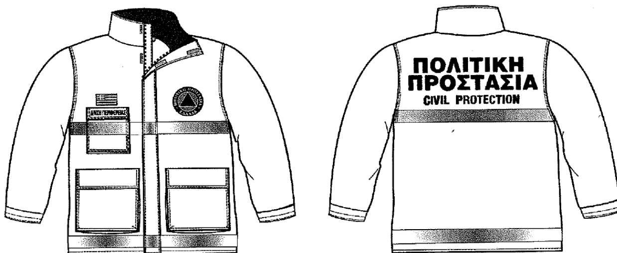
Εικόνα 1. Επιχειρησιακά μπουφάν Πολιτικής Προστασίας και τα γιλέκα Πολιτικής Προστασίας:

Η παρουσία υπαλλήλων Πολιτικής Προστασίας στον τόπο μιας καταστροφής, με πολιτική περιβολή, δεν δηλώνει την ιδιότητά τους. Αυτό έχει σαν αποτέλεσμα, σε επιχειρησιακό επίπεδο να χάνεται αρκετές φορές πολύτιμος χρόνος μέχρι την ταυτοποίησή τους, από υπηρεσιακούς παράγοντες και κυρίως να περνά απαρατήρητη η παρουσία τους από πολίτες οι οποίοι αγνοούν κατά κανόνα εντολές ή παραινήσεις τους. Σύμφωνα με το 4678/22-11-2004 έγγραφο ΓΓΠΠ, τα επιχειρησιακά μπουφάν Πολιτικής Προστασίας θα πρέπει να έχουν την ακόλουθη μορφή: